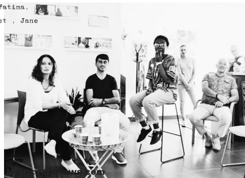
Partages d'expériences : leur engagement n'est pas d'aujourd'hui