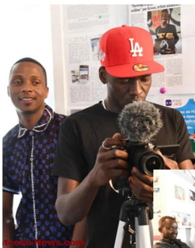
Personnes réfugiées, Membre du CA, Service civique, Artistes réfugiés, professionnels..