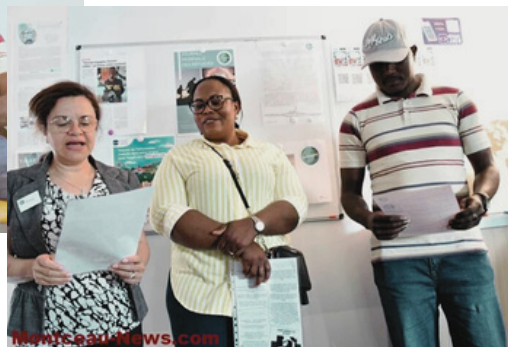
Preuves de résilience, ils sont de véritables richesses humaines pour notre pays