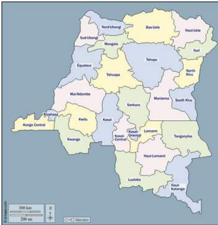
Carte du Congo Kinshasa et ses 26 provinces