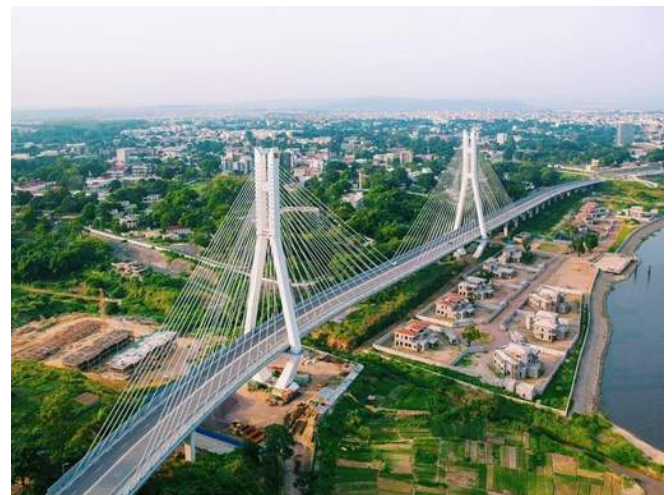
Vue de Brazzaville ( RFI )