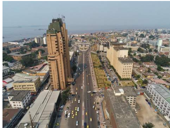
Immeuble Sozacom- Kinshasa