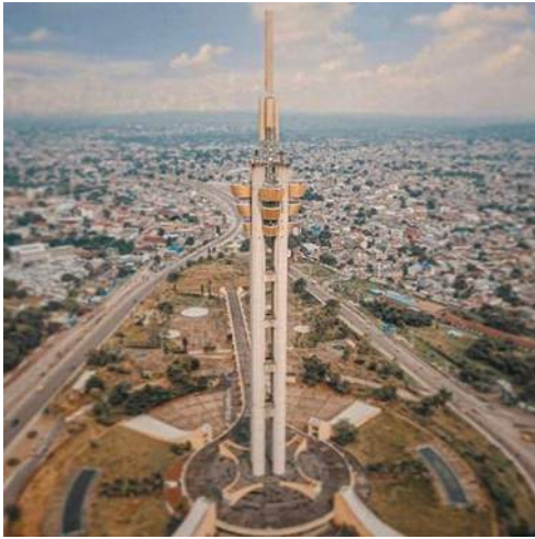
Echangeur de Limete - Kinshasa