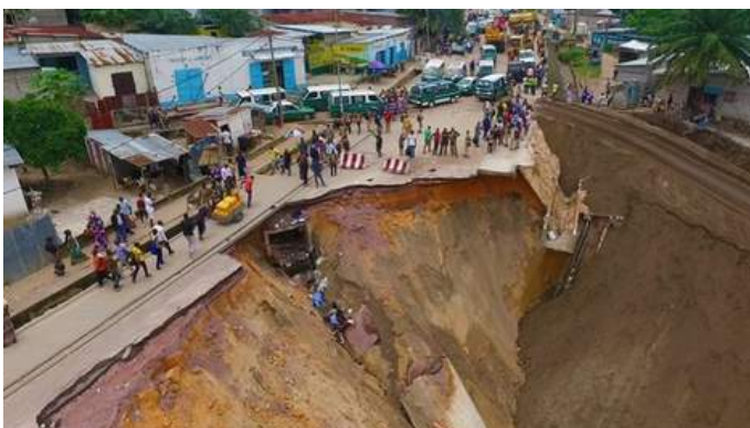
Erosion à Kintélé ( Brazzaville 2019 )