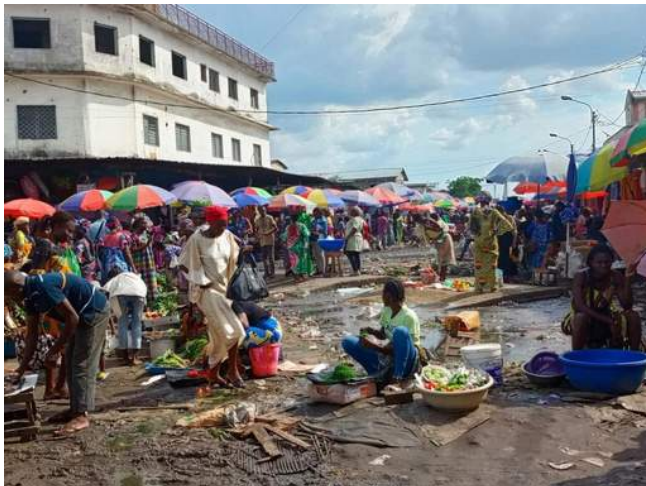
Marché Total de Brazzaville